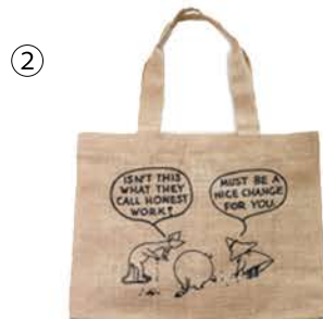
② "ISN'T THIS WHAT THEY CALL HONEST WORK?" — "MUST BE A NICE CHANGE FOR YOU."

張り切るスニフに振り回されて、怒ってしまうムーミン。スニフにのんびり生きたいこと伝えるひとコマです。