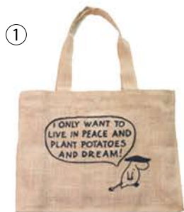
① "I ONLY WANT TO LIVE IN PEACE AND PLANT POTATOES AND DREAM!"

たっぷり入って、お買いものにもお出かけにも使える丈夫なジュート製のトートバッグ。原作コミック『ひとりぼっちのムーミン』のイラスト&セリフをそのままプリントしています。新しい家を買うお金を貯めるために奔走するムーミンたち。はたして……。