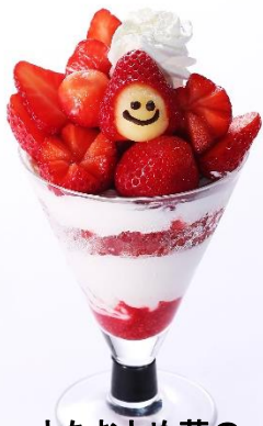
とちおとめ苺の スマイルパフェ