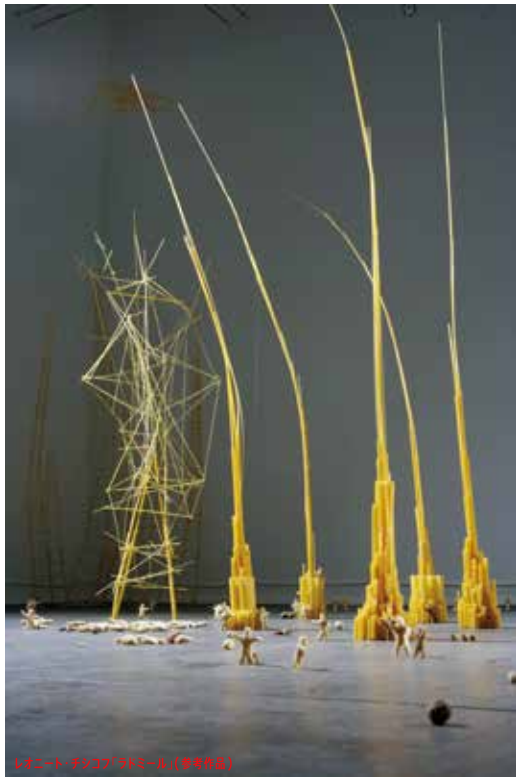
レオニート・チシコフ「マトリール」(参考作品)