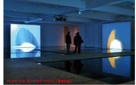
アレクサンドル・ボノマリョフ「ナルシス」(参考作品)

市原市南部の里山や閉校した学校を舞台に、現代アート作品の展示や体験型のワークショップなどを行うアートフェスティバル「房総里山芸術祭 いちはらアート×ミックス2020」を開催。菜の花が咲き誇る美しい里山とアートで非日常を体感しよう。