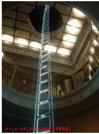
ターニャ・バダニナ「空への階段」(参考作品)