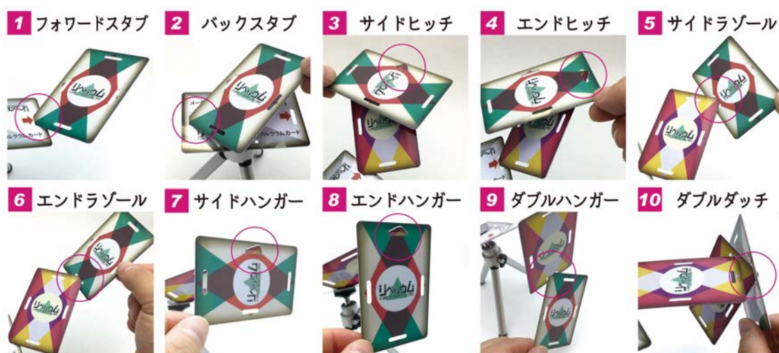
「リベリウム」差し込み方・引っ掛け方の技：全10種類

1人でどこまで繋げられるかを楽しんだり、人数問わず個人戦・団体戦で競い合ったり、ドキドキハラハラしながら、自由なルールで自在に遊ぶことができます。