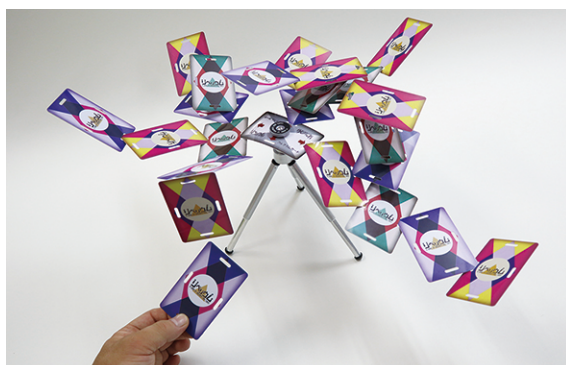
「リベリウム」差し込みイメージ

誰でも簡単に、いつでも・どこでも・誰とでも楽しめますので、家族の団らんやホームパーティーなどにも最適です。プラスチック製で濡れ・汚れにも強く、パーティー・イベント・レクリエーションなどでも安心して気兼ねなく楽しむことができます。特に、合コンなどでは、カードを崩さないようにするドキドキハラハラが吊り橋効果となり、新たな恋が芽生えるかもしれません。