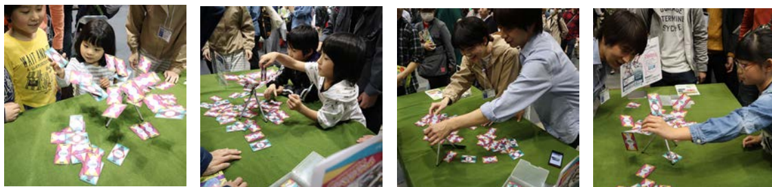
キャンペーン投稿画像イメージ

投稿された写真の中から「いいね！」や「お気に入り」の数ではなく、ひときわ楽しみながら遊んでいるシーンを投稿された当選者5名に、ダイレクトメールを送信のうえ、賞品として「リベリウム」（限定カラー・非売品）をプレゼントします。当選者の数が、規定の人数分に達しましたら、本キャンペーンは終了になります。