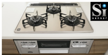
【Siセンサー付き3口ガスコンロ】