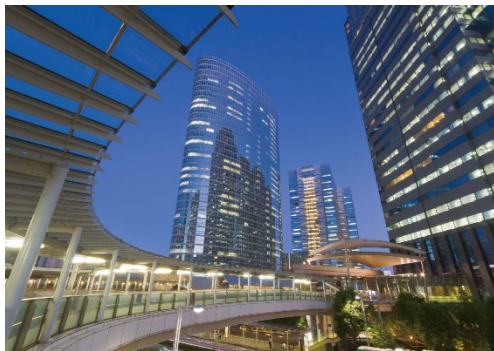
【品川インターシティ】