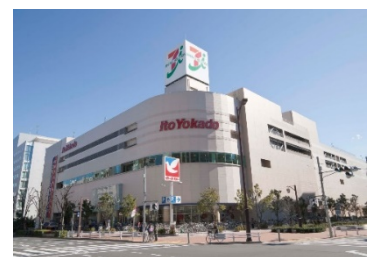
【イトーヨーカドー 大森店】