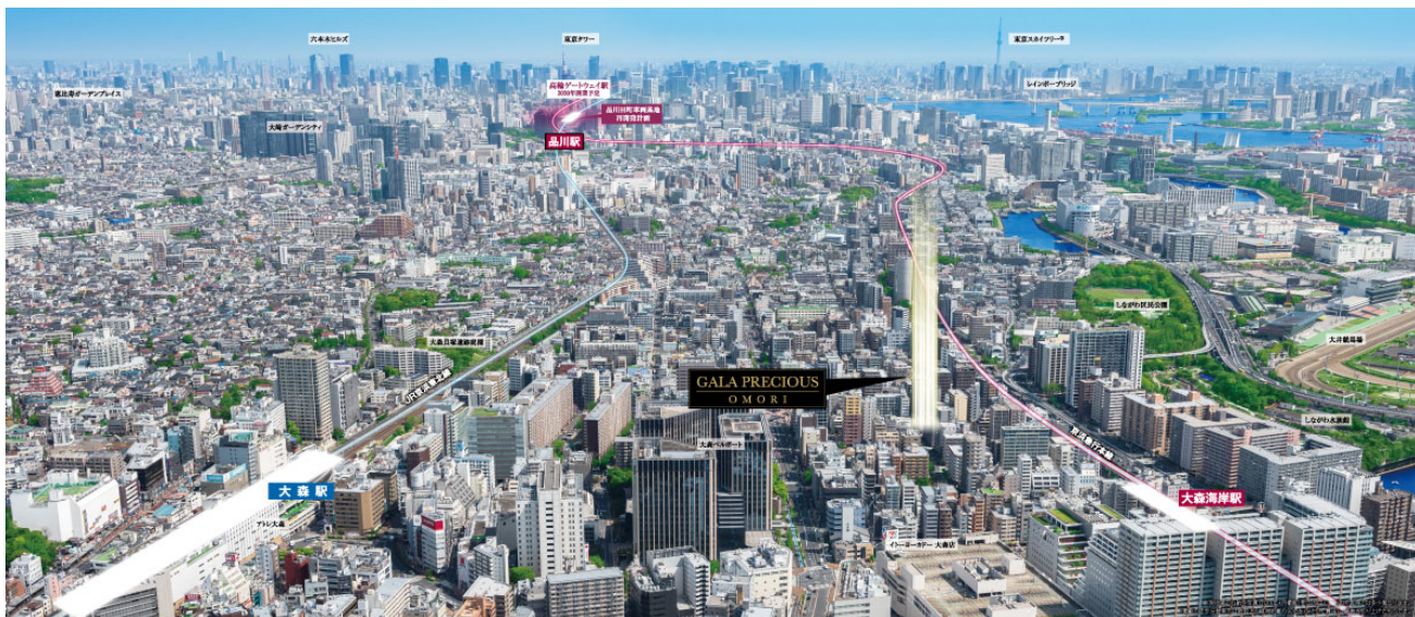
【現地上空からの航空写真】