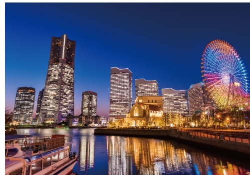
【横浜みなとみらい21】