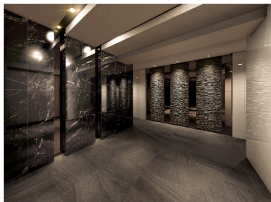
【エントランスホールイメージ】