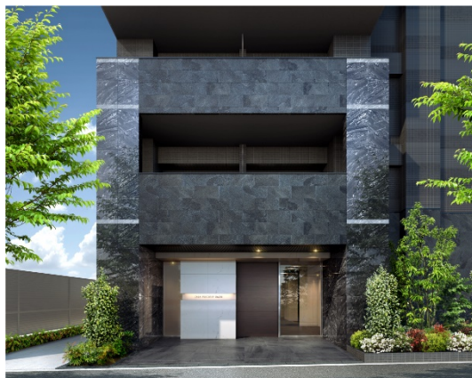
【エントランスイメージ】