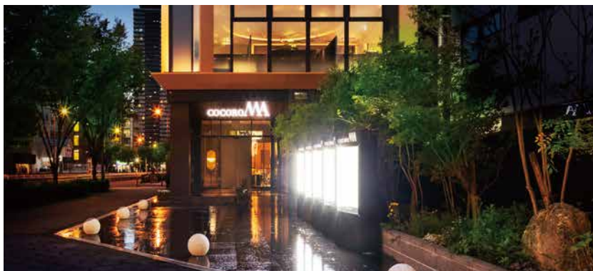
エントランスアプローチ