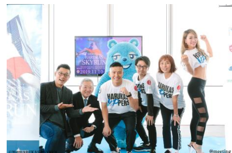
2019年「HARUKAS SKYRUN」記者発表の様子