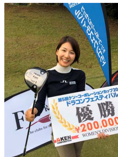
<ドラコンフェスティバル2019の様子>