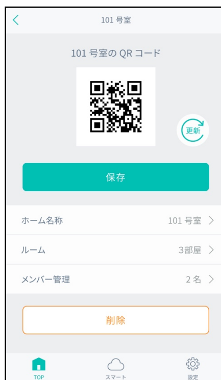
※1QR-Link (特許申請済み) コード読み込み画面イメージ