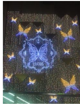
アポロビル・ルシアスビル