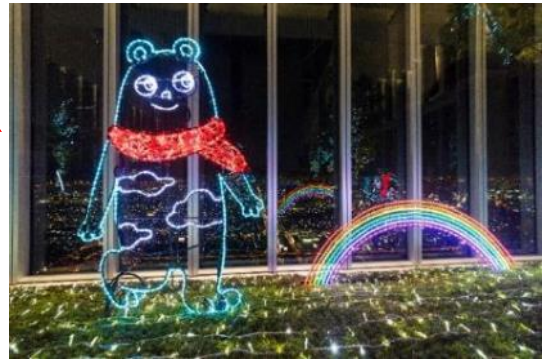
②ハルカス300（展望台）58階天空庭園