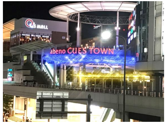
あべのキューズタウン