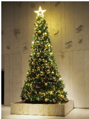
③大阪マリオット都ホテル19階ロビー