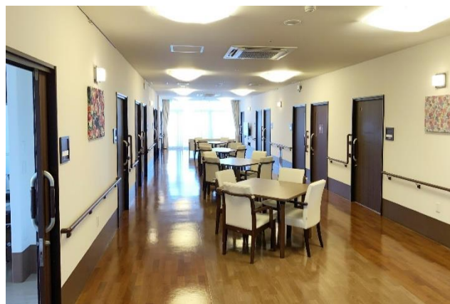
西上尾ホスピスケアそよ風<リビング・ダイニング>