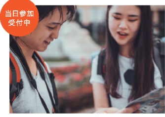
※詳しくは受付会場にて

地図をもとに、神社、寺院、動物園など、アベノ・天王寺の様々な場所を制限時間内に回り、得点を集めるスポーツです。