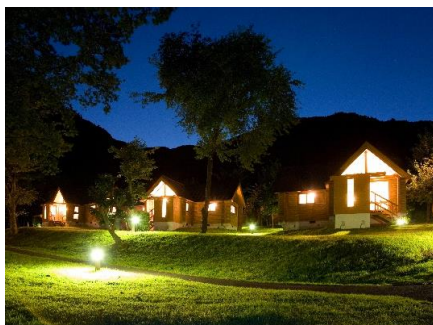
▲夜のヴィラコテージ風景