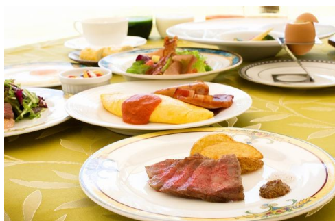
▲朝食近江牛ミニステーキ付きオーダーブッフェ