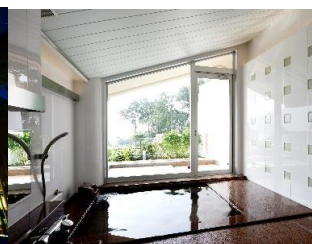
▲貸切温泉家族風呂