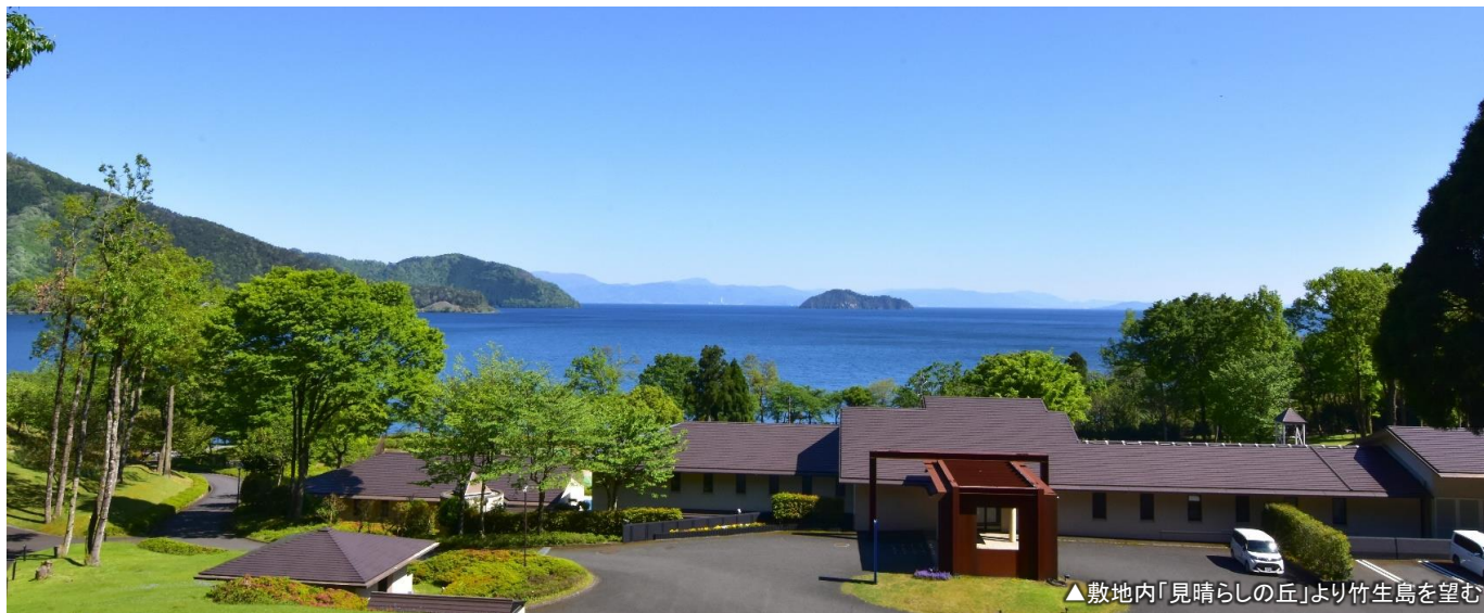
▲敷地内「見晴らしの丘」より竹生島を望む

写真は当ホテルの正面玄関の上、小高い丘にある通称「見晴らしの丘」から見渡す「絶景」です。蒼く澄んだ琵琶湖と、パワースポット竹生島が一望でき、癒しのスポットの一つです。その他敷地内には「テニスコート」や「夏季限定の屋外プール」もあり、滞在中はホテル内をゆっくり散策するにはピッタリの場所たくさんあります。時には野生のお猿さんや、小動物なども見れる、そんな自然いっぱい場所です。