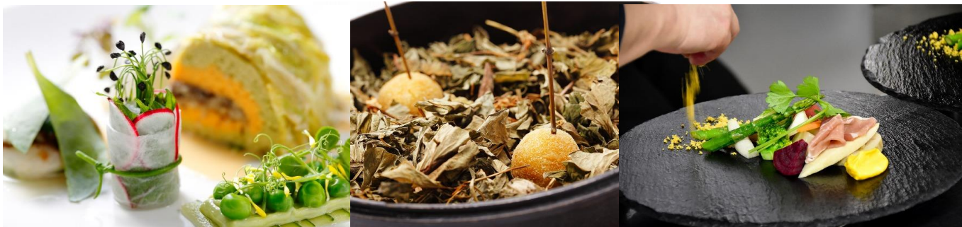
▲地産の野菜や湖魚も使用しかつ繊細な仕立