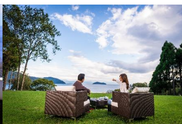
▲絶景の丘で過ごす