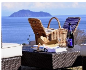
▲敷地内でピクニック気分

建物は本館棟とヴィラ棟に分かれており、本館棟にはフロント、ラウンジ、レストラン、多目的スペースなどが用意されています。客室は本館棟に「80㎡のスイートルーム」が2部屋と「40㎡のレイクビューシアートルーム」が4部屋あります。特に「レイクビューシアートルーム」は大きな窓から琵琶湖の景色が一望できるので、開放感を望むならイチ押しのお部屋です。その他ヴィラコテージ棟は全部で9棟すべてリビングルームが付いた60㎡のスイート仕様です。ヴィラコテージは「和室タイプ」が3棟、「洋室タイプ」6棟に分かれており、なかでも「洋室タイプ」の1部屋は大型犬と一緒に泊まれる「ドッグヴィラ」も1棟ございます。また、本館棟には「貸切温泉家族風呂」も2か所用意され、当社グループで同じ滋賀県長浜にある「北近江の湯」から一部運搬し温泉としてご利用いただいています。上質かつ優雅な空間と、自然に包み込まれる「非日常」の世界でゆっくりと過ごすことができる空間です。