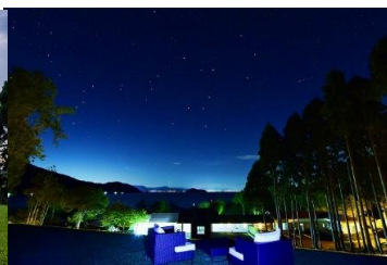
▲満天の星空が望める