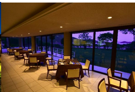
▲夕方のレストラン(全面ガラス窓)