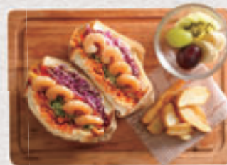
シュリンプサンド