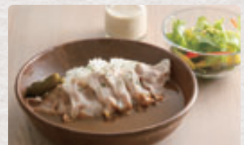
ピーチポークのしゃぶカレー