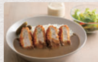
厚切りカツカレー