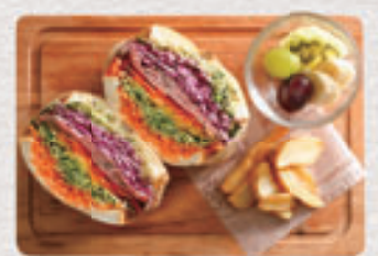
自家製ローストビーフサンド