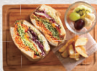
ハーブチキンサンド

無農薬・無肥料の自然栽培で育てた野菜をふんだんに使用しています。また発芽野菜を含む野菜の栄養も一度にとることができ大変健康的なサンドイッチです。