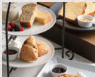
アフタヌーンティセット

毎日食べても大丈夫! 店内仕込みのバイクドスイーツを紅茶といっしょにお楽しみください