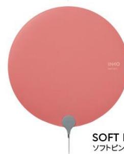
SOFT PINK ソフトピンク