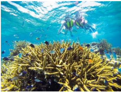
奥西表ボートシュノーケル