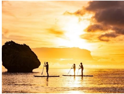
夕風 SLOW SUP