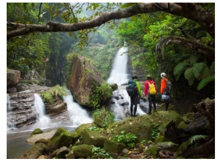
ダイナミックアドベンチャー「ナーラの滝」