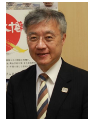
パネリスト 中岡 司 文化庁次長