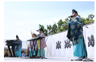
オープニング 天地雅楽 音楽ユニット