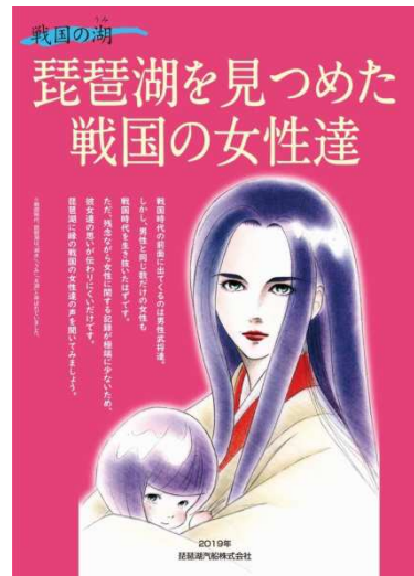
戦国リーフレット（イメージ）