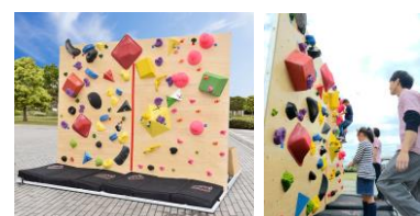
ボルダリング イメージ

握力や跳躍力、背筋力などその場で簡単にチャレンジできるスポーツテストを開催します。