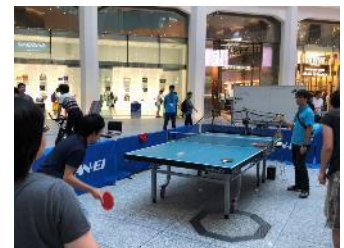
卓球ゾーン イメージ