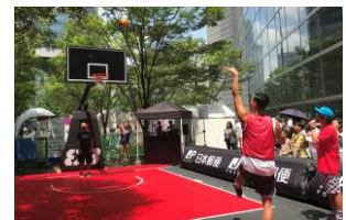
3x3バスケットボールゾーン イメージ