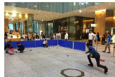
ボッチャゾーン イメージ

ユニバーサルスポーツとして注目を集めるボッチャは、どなたでもすぐに体験できる手軽さの一方、技術を磨いたトップ選手のミラクルショットや戦術によって局面が変わる奥深さが魅力です。会場内の特設コートにて、指導員による体験会やミニゲームなどをお楽しみいただけます。