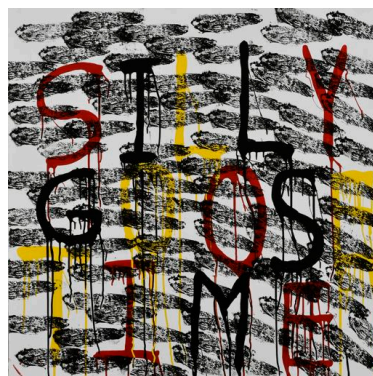
SILLY GOOSE TIME

@michaelrmh_official https://www.instagram.com/michaelrmh_official/