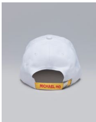
Asian Squat Hat