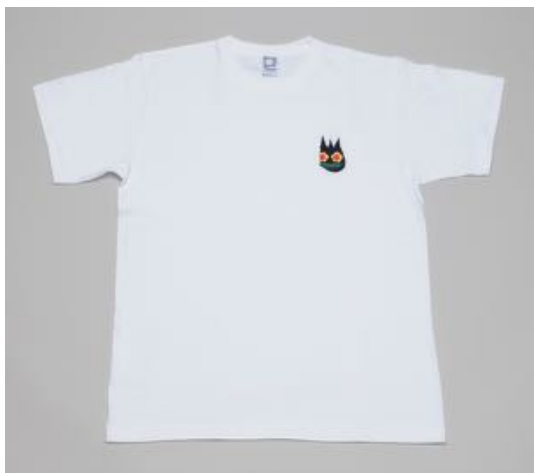
Asian Squat Tee