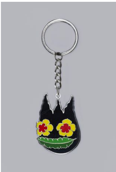
Asian Squat Key Chain 価格： ¥ 800 + 税 限定数：300