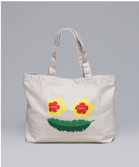
Harakitty 価格：¥3,700 + 税 限定数：100