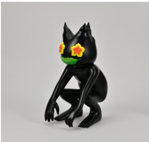
Asian Squat (フィギュア) 価格：¥30,000 + 税 限定数：150