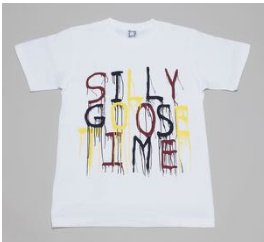
Silly Goose Time