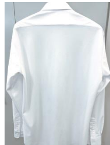
カンコー インフィニスタ