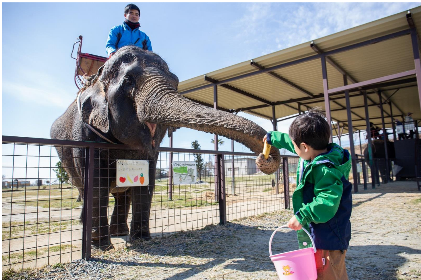
【ゾウへのエサやり】