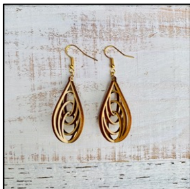
バンブー(竹)アクセサリー by swan's drops