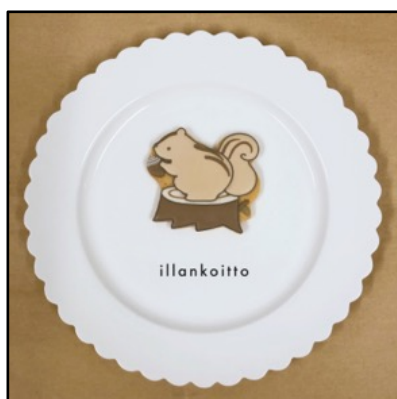
アイシングクッキー by illankoitto