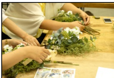
体験教室の様子・1

子供から大人まで、ハンドメイド初体験の方でも気軽に参加できる体験教室「マルシェのがっこう」を開催。ものづくり市民が先生となり、アクセサリやフラワーアレンジ、クラフト、伝統工芸まで、 世界にひとつ・自分だけのハンドメイド作品づくりを体験 できます。