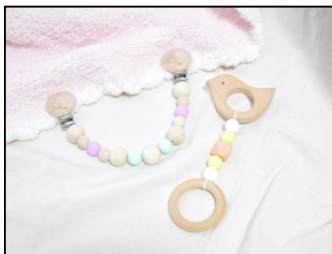
ベビー用グッズ(歯固め等) by Petit lune by tiny teeth