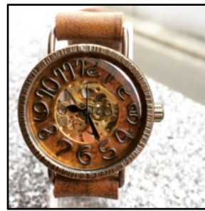
【出品例2】手作り腕時計