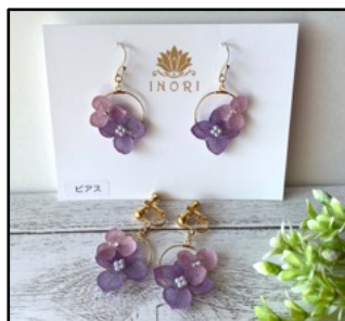
【出品例1】本物の花を使ったアクセサリ

全国各地から集まるものづくり市民による、アクセサリやインテリア・雑貨、靴・カバン、ファッションなど、プロの作品と比べても遜色ない 個性的・高品質な30,000点以上の手作り作品 が会場を埋め尽くします。また、ケーキやクッキー、パン、はちみつ、紅茶など、こだわりの手作りフードも出店されます。