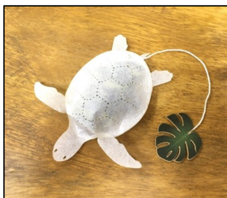
ウミガメのティーバッグ by ocean-teabag