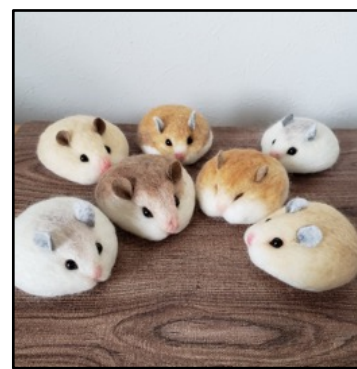
羊毛フェルトドール by utuca