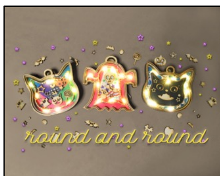
ハロウィンランタン作り by posh-design