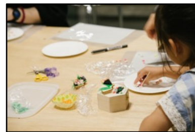
体験教室の様子・2