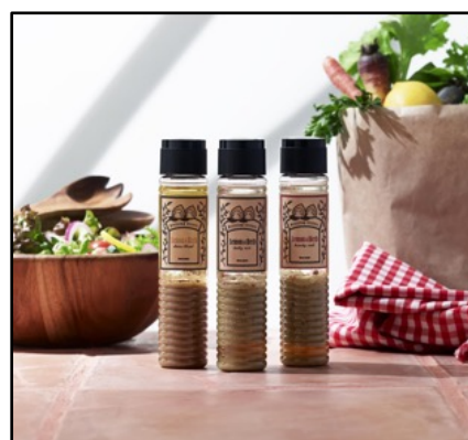
生ドレッシング by Dressing Sisters