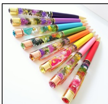
ハーバリウムボールペン作り by Pastel Gardens