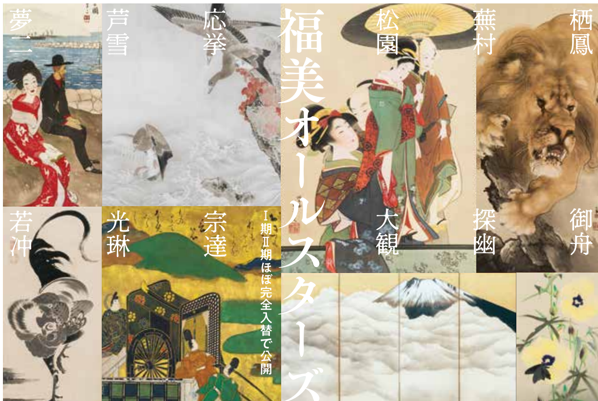
上段左より(すべて部分) 竹久夢二 切支丹波天連渡来之図 1914(大正3)年、円山応挙 巖頭飛雁図 1767(明和4)年、上村松園 人形遣之図 20世紀前半、竹内栖鳳 金獅図 1906(明治39)年、下段左より(すべて部分) 伊藤若冲 群鶏図押絵貼屏風 1797(寛政9)年、俵屋宗達 益田家本伊勢物語図色紙 第二段「西の京」 17世紀、横山大観 富士図 1945(昭和20)年頃、速水御舟 露潤 1932(昭和7)年

オープンを記念した開館展では、会期をⅠ期・Ⅱ期にわけ、ほぼ完全入替で、約80点の作品を公開いたします。俵屋宗達(生没年不詳)や尾形光琳(1658-1716)の琳派、狩野山楽(1559-1635)、狩野探幽(1602-1674)などの狩野派、円山応挙(1733-1795)、長沢芦雪(1754-1799)、呉春(1752-1811)などの円山四条派など江戸時代の絵画から、竹内栖鳳(1864-1942)、上村松園(1875-1949)など明治以降に活躍した画家たちの名品を一挙公開します。