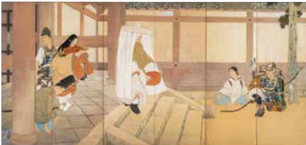
橋本関雪 後醍醐帝 1912(大正元年)