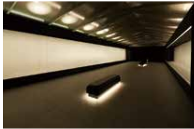
「蔵」をイメージした展示室