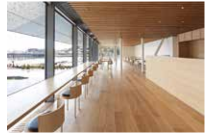
「渡月橋」が最も美しく見えるカフェ

福田美術館の建築は、伝統的な京町家のエッセンスを踏まえつつ、これからの100年のスタンダードとなるような新しい日本建築を志向しています。洗練された和モダンの外観デザインは、周辺の自然に違和感なく溶け込んでおり、また内観にも「蔵」をイメージした展示室、「縁側」のような廊下、「網代文様」から着想された壁面ガラスなど、随所に日本的な意匠が見られます。庭には大きな水盤があり、目前を流れる大堰川・桂川に連なる水鏡のごとく、嵐山を映し出します。