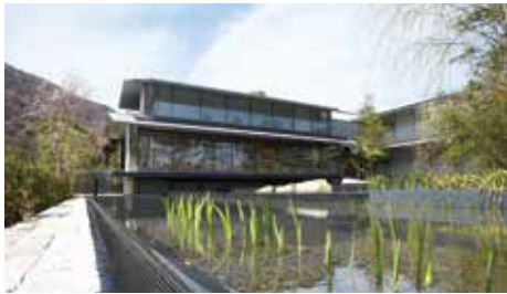
嵐山を映し出す「水鏡」となる大きな水盤