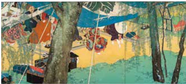
木島櫻谷 駅路之春 1913(大正2)年