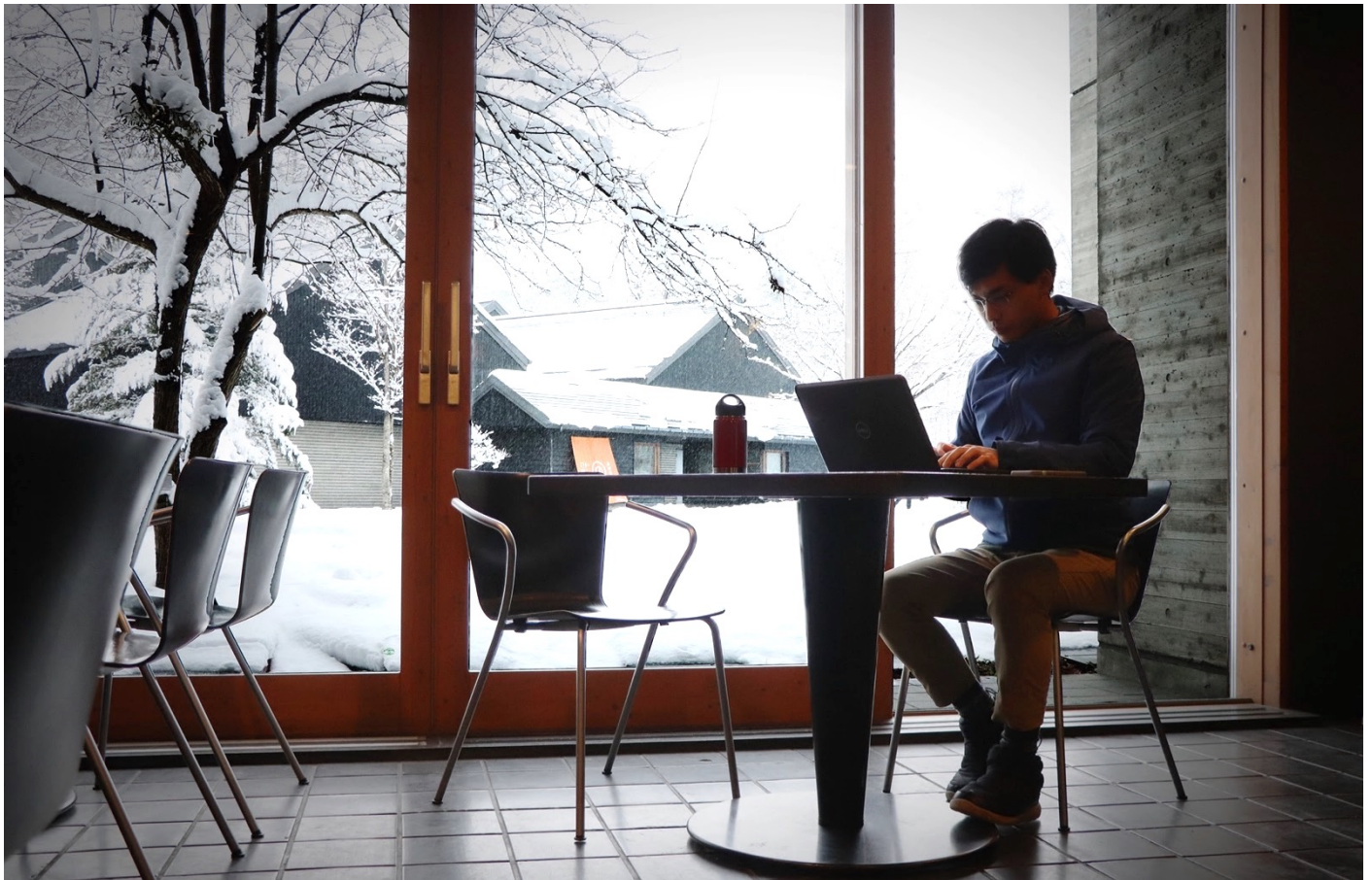
星野温泉 トンボの湯近くのカフェでワーケーション

星野リゾートが運営する自然と文化を愛する人々が集う場所「軽井沢星野エリア」では、ワークプレイスとリフレッシュメント（心身の爽快）を組み合わせた「温泉ワーケーションプラン」を2020年1月17日～3月19日に販売します。温泉ワーケーションをサポートする7つ道具を持って、「星野温泉 トンボの湯」をはじめ、軽井沢星野エリアの様々な場所でワーケーション体験ができる、ビジネスパーソンに向けたプランです。