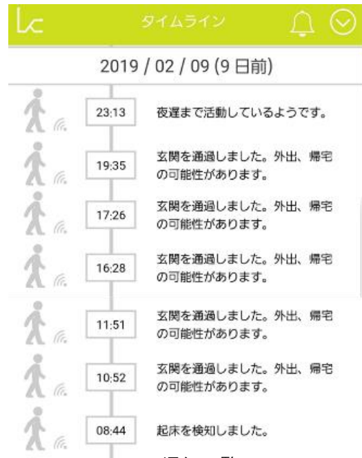
通知一覧 事前に設定した通知事項を 時系列で表示