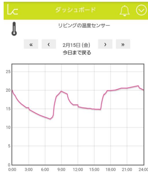
温度グラフ 一日の室温の推移を グラフで表示