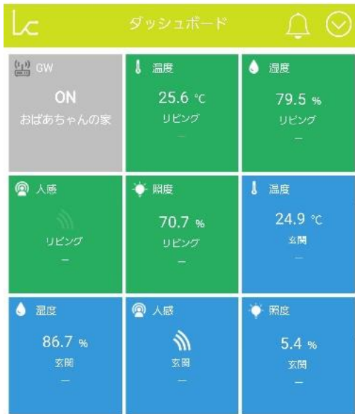
リアルタイムで状況を確認 全センサーのリアルタイム データを一画面で表示