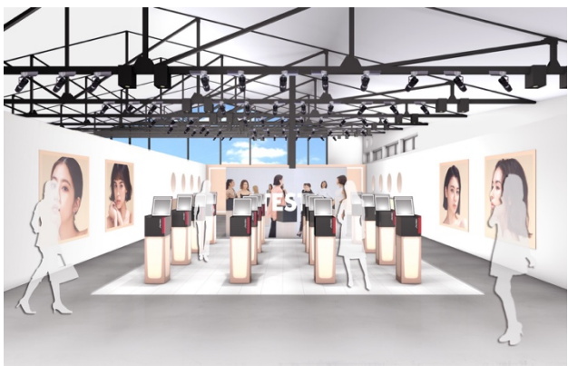
オフィシャルムービーで使用されたスタジオセットで TESTできる(タッチ&トライ)