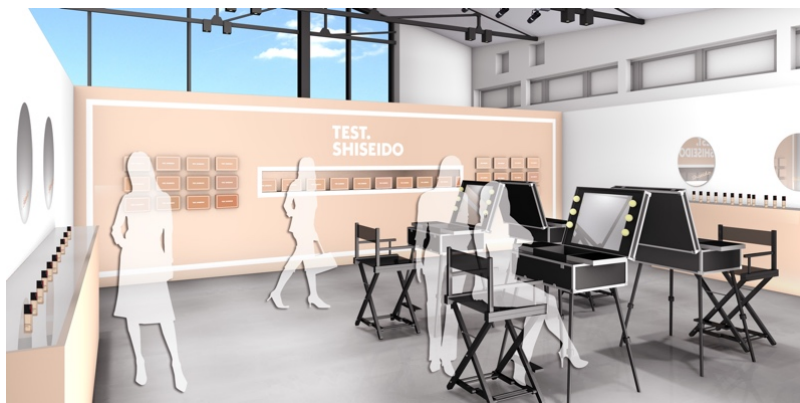
プロによるタッチアップコーナー

資生堂は、世界85の国と地域で展開している「SHISEIDO」より、新ベースメイク【全11品目36品種】を、2019年9月1日(日)から世界各国で順次発売します。メインとなる「シンクロスキン セルフリフレッシュング ファンデーション」の特長は「24時間自然体」。笑っても動いてもメイク直しを気にせずいられる、画期的なリキッドファンデーションです。この商品の発売にあわせ、「このファンデーションに、あなたは何点つけますか？」と投げかける「TEST.」キャンペーンを展開。実際に「SHISEIDO」新ファンデーションをお試しいただけるポップアップイベント『TEST. SHISEIDO』が2019年9月7日(土)、8日(日)の2日間限定で表参道 SO-CAL LINK GALLERY (東京都渋谷区神宮前4-9-8) にオープンいたします。