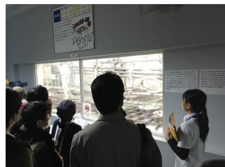
<2019年 春酒蔵開放の様子>

春の酒蔵開放に引き続き「おちょこで試飲」と題し、環境に配慮して試飲用のプラスチックカップを廃止し、有料（100円）のおちょこ（※1）で提供します。おちょこをご購入のお客様は、無料試飲・有料試飲、振る舞い酒と垂れ口を試飲していただけます。ご来場者のみなさまのご協力により、約2万個のプラスチックカップの削減につながります。