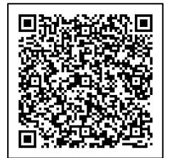
スペシャル工場見学 応募専用ホームページ

白鶴ホームページ： http://www.hakutsuru.co.jp/customer/