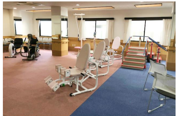
SWITCH Recovery L@B 板橋<内観>