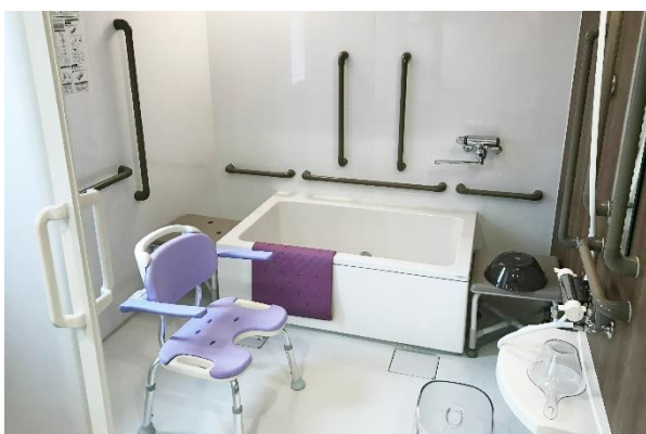
太田ケアセンターそよ風<グループホーム個浴室>