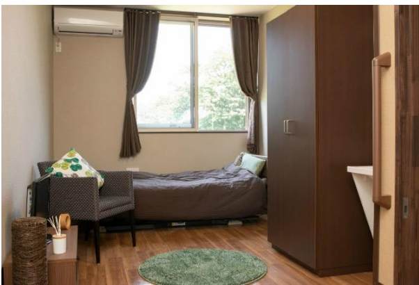
盛岡北ケアコミュニティそよ風<居室>