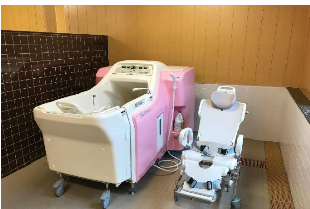
盛岡北ケアコミュニティそよ風<機械浴室>