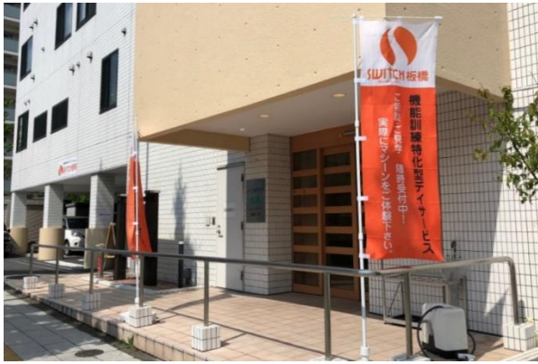
SWITCH Recovery L@B 板橋<外観>