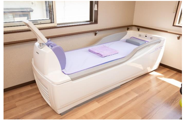
盛岡北ケアコミュニティそよ風<リハビリコーナー2>