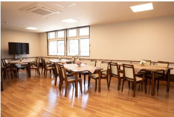
盛岡北ケアコミュニティそよ風<ダイニング>