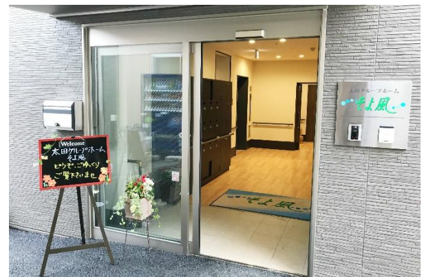
太田ケアセンターそよ風<エントランス>