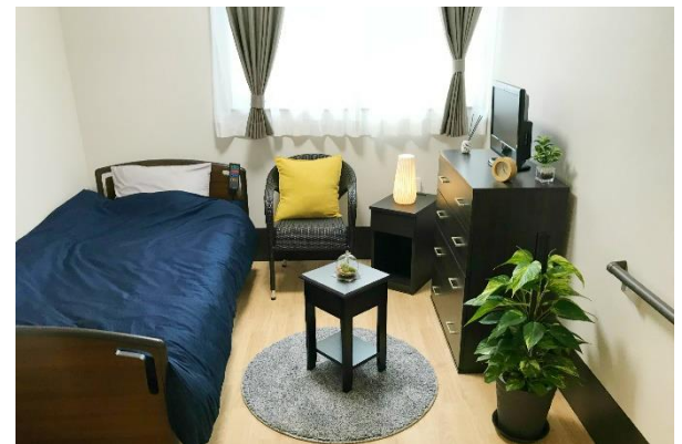
太田ケアセンターそよ風<グループホーム居室一例>