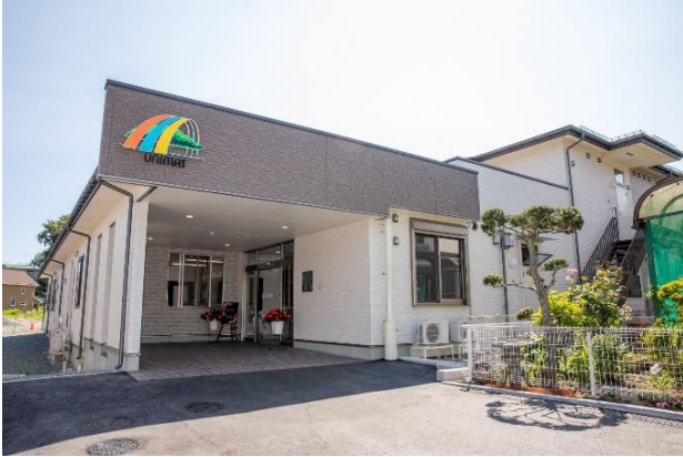
盛岡北ケアコミュニティそよ風<外観>