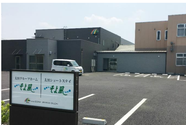
太田ケアセンターそよ風<外観>