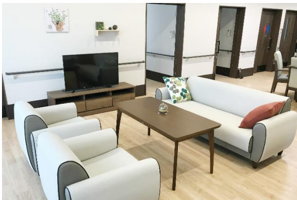
太田ケアセンターそよ風<グループホーム リビング>