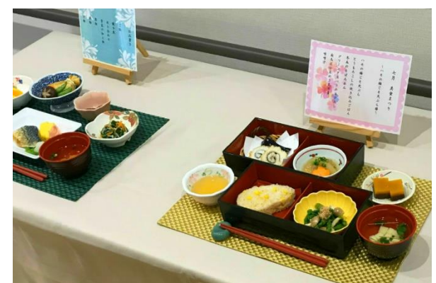
太田ケアセンターそよ風<グループホーム食事一例>