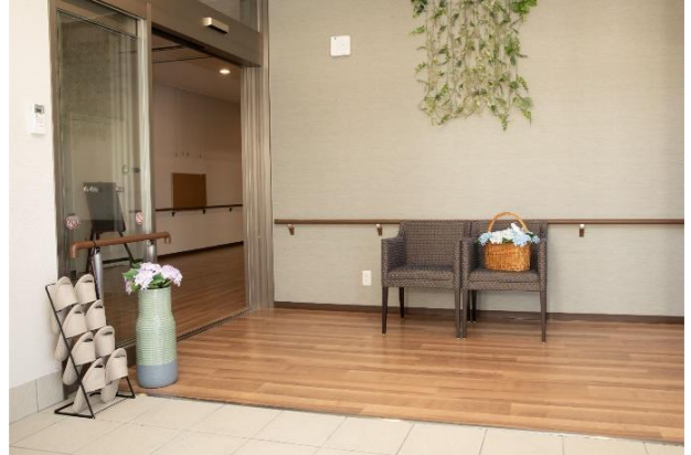
盛岡北ケアコミュニティそよ風<エントランス>