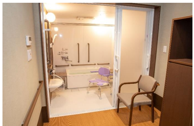
盛岡北ケアコミュニティそよ風<個浴室>