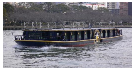
<クルーズ船「ひまわり」>