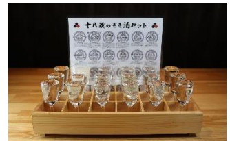
<16 蔵元 18 銘柄のきき酒セット>

同研究所は、酒類市場の発展と正しい知識の普及のため、日本酒に限らない万（よろず）酒類の研究を科学的視点から行い、料理との関係性の究明（ペアリング）や新たな混和技術の開発を日々行っている。