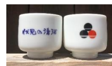
<「伏見の清酒」おちよこ>

鏡開きセレモニーの乾杯時にお渡しする「伏見の清酒」おちよこをそのままプレゼントいたします。