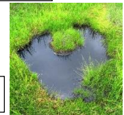
ハート形の池塘(ちとう)

【URL】弥陀ヶ原ウォーク https://www.alpen-route.com/_wp/event/4870