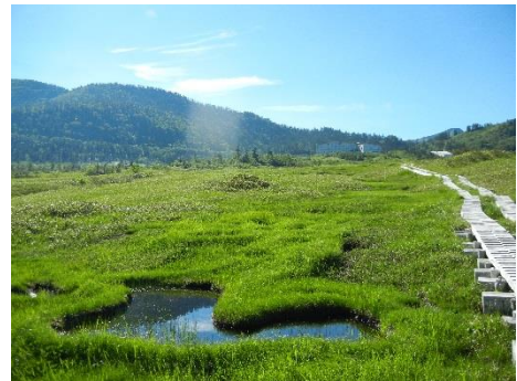
広大な弥陀ヶ原の湿原

トレッキング後は弥陀ヶ原ホテルのロビーラウンジでクレームブリュレと湧水を使った雲海コーヒーで一息つきながら、一面ガラス張りのロビーから雲海、夕陽など刻一刻と表情を変える景色を眺められます。