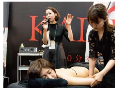
機械に頼らないオールハンドテクニックを伝授します

参加申し込み／資料請求はコチラから： https://kaizenbody.jp/lp_owner/ お電話でのお問い合わせ：フリーダイヤル 0120-188-773