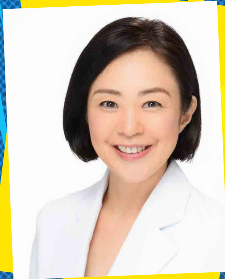
管理栄養士・料理研究家 麻生れいみ 氏