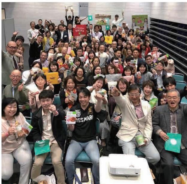
第3回ローカーボスプリングフェスティバル in 大阪

有識者や実践者による講演、糖質制限・健康まつわる企業の商品販売や情報発信、参加者による交流プログラム等を予定。