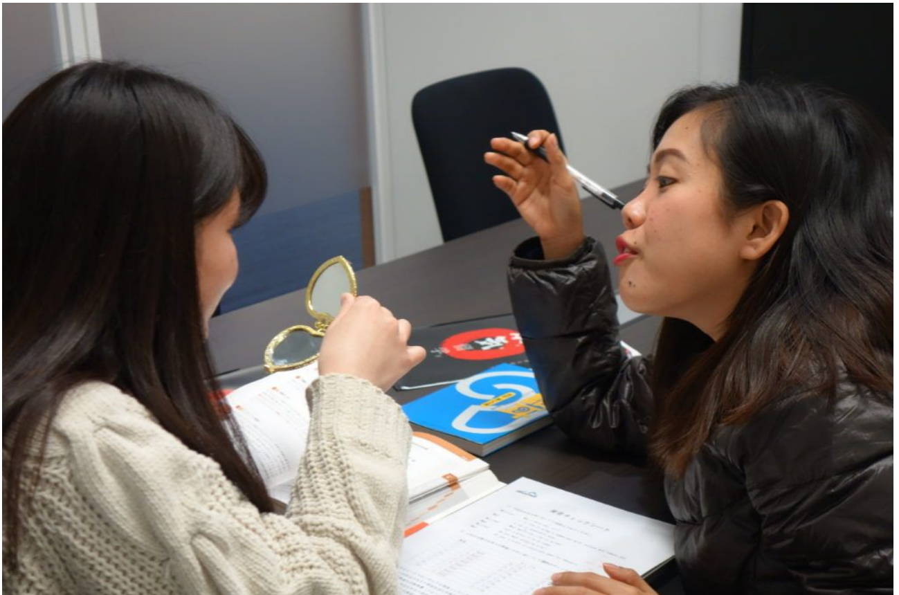
鏡で「自分の唇・舌の動き」を確認する生徒さま