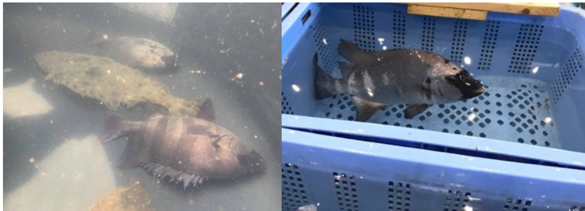
昨年、壱岐島で睡眠中のイシダイと、豊洲市場に運ばれた「起きたて！」のイシダイ

本プロジェクトは活魚を睡眠状態にし、高過密輸送することを実現した”魚活ボックス”を利用し、少量多品種であり、これまで都市圏の飲食店や食卓に登場する機会が少なかった日本の自然豊かな離島の魚たちを生きたまま都市圏へ輸送し、「起きたて！」活魚の気軽な喫食機会の増加を目指しています。