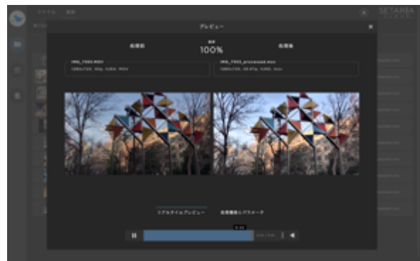
処理比較プレビュー (左: 処理前 / 右: 処理後)

ワークフロー機能では、設定値や映像処理指示を前もってカスタマイズすることで、必要な映像の変換処理を簡単に実施することが可能です。また、92種類以上の【カラーエフェクト】も搭載しています。