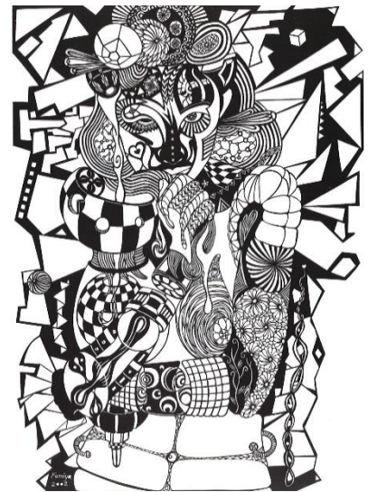
《AQUARIUS》 2002年 69×52 cm 紙（切り絵）