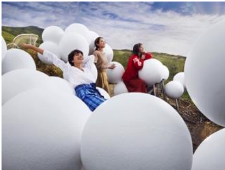
Cloud Bed (クラウドベッド)