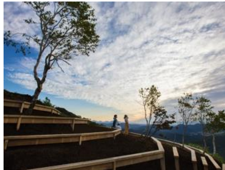
Contour Bench (コンターベンチ)