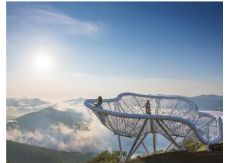
Cloud Pool (クラウドプール)