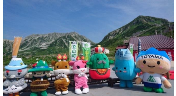
富山県内のご当地キャラクターが室堂に集合