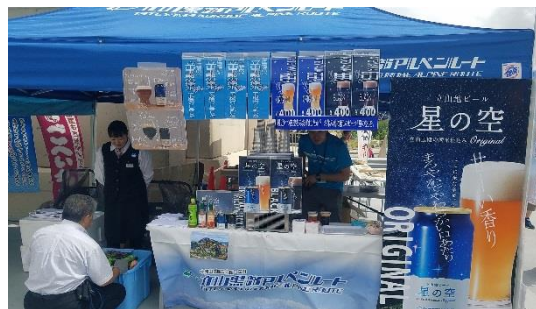
立山地ビール「星の空」の試飲・販売