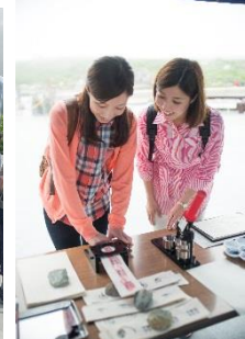
立山護符・缶バッチづくり