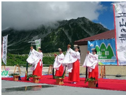
少女巫女による稚児舞「立山の舞」の披露