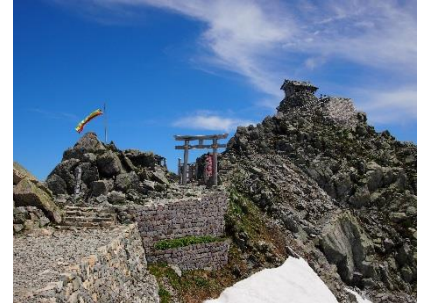
標高3,003m雄山山頂、 天空の社「雄山神社峰本社」

【雄山神社峰本社】7月1日～9月30日期間開設され、山岳信仰の聖地でのお祓いとお神酒をいただく参拝は、神秘的で貴重な体験になるはず。