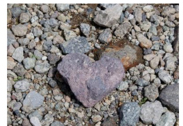
雄山山頂に続く登山道には、 ハート形の石が・・・

【URL】立山山頂ウォーク https://www.alpen-route.com/_wp/event/4762