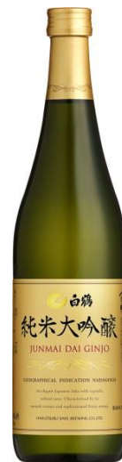
720ml 1,340 円