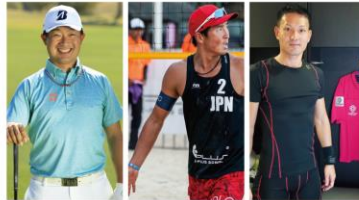
市原 弘大 プロゴルファー