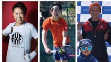
佐山 万里菜 プロテニス