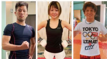
鈴木 隼人 選手：FIVB World Tour 第48回アジア大会男子選手権大会