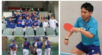
さぶ清流野球クラブ 選手：FIVB World Tour 第48回アジア大会男子選手権大会