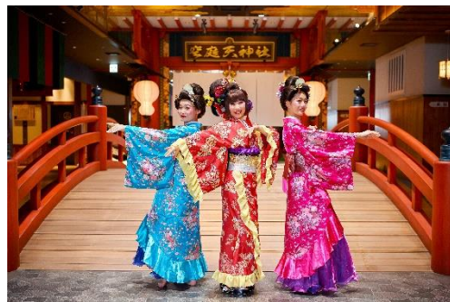
空庭ややこをどり

名 称 : 空庭ややこをどり 開催日時 : 2019年7月20日(土)～9月1日(日) 時間 : ①13:30～②15:30～③18:15～④20:00 会場 : 2F弁天通り 空庭天神前