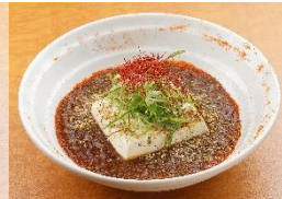
旨辛!! 丸ごと麻婆豆腐 580円