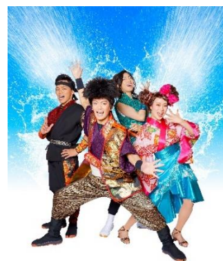
The GOEMON 天空スプラッシュ！！

名 称 : The GOEMON 天空スプラッシュ！！ 開催日時 : 2019年7月20日（土）～9月1日（日）毎日開催 時間 : ①12:30～②15:00～③17:30～ 1ステージ約15分 会場 : 空庭温泉 4F天空庭園特設会場 参加費 : 無料 ※入館料は必要 備考 : 雨天時は館内でグリーンティング