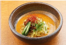
痺辛! 冷やし豆乳担々麺 680円