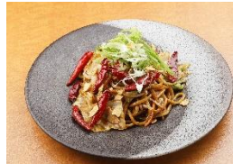
激辛!!! ソース焼きそば 720円

夏こそ激辛この一杯！！ 激辛料理で体温を下げ涼をとりましょう。辛味成分が消化器を刺激し食欲を増進、脳内麻薬作用により夏バテを吹き飛ばします。