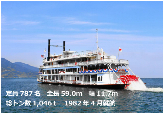
定員 787名 全長 59.0m 幅 11.7m 総トン数 1,046t 1982年4月就航

びわ湖の代表的なエンターテインメントクルーズ船「外輪船ミシガン」は、1982年の就航以来、これまで延 800 万人以上の方にご乗船いただいております。