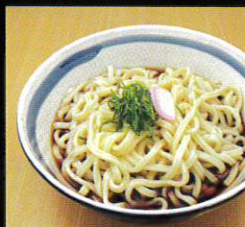
学割冷やしうどん