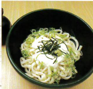
山かけトロロうどん