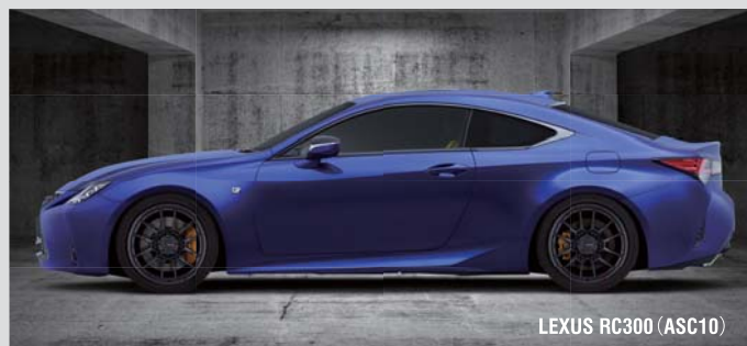
LEXUS RC300 (ASC10)