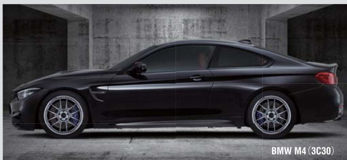
BMW M4 (3C30)