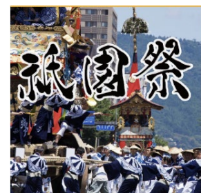
令和元年 祇園祭特集！

令和元年の祇園祭に合わせて、Hello KYOTO に新機能「イベントカレンダー」「おすすめスポット」「フレームカメラ」が追加されました！ Hello KYOTO も今年の祇園祭を盛り上げます！新機能で新しい祇園祭を発見できるかも！？