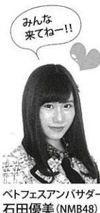
ベトフェスアンバサダー2019 石田優美(NMB48)