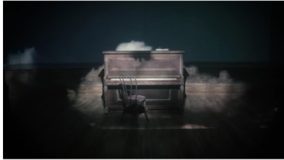
● Book of Romance and Dust トレイラー https://youtu.be/nAEF_EUVa90