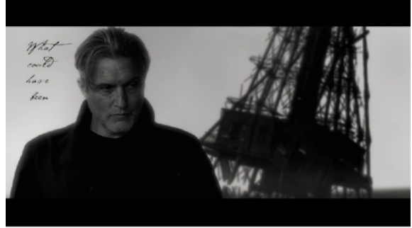
● Bested Bones ミュージックビデオ https://youtu.be/s3bSgz8EXal