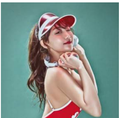
DJ HENNEY(ハニー) ※韓国/日本初出演

2012年年始、フライドチキンの作り方を紹介する動画が大ヒット、100万人以上のファンを獲得し、一気に知名度を得た。同年8月「18歳の贈り物」にて、業界デビューを果たし、日本のグラビア界でもデビュー。天使のようなルックスに、悪魔のボディを持ち合わせた天然素材。性格も良く、バラエティーやドラマ、映画、CM、司会など幅広くこなす。