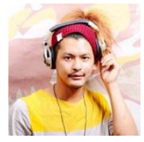
DJ 嵐 ※ex. いきなりマリッジ2 ex. あいのりメンバー