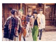
Flow Back (フロウバック)