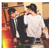
#R ※玉木亮/ex. あいのりメンバー &Roccol