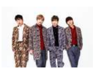
FIZZY POP (フィジーポップ)